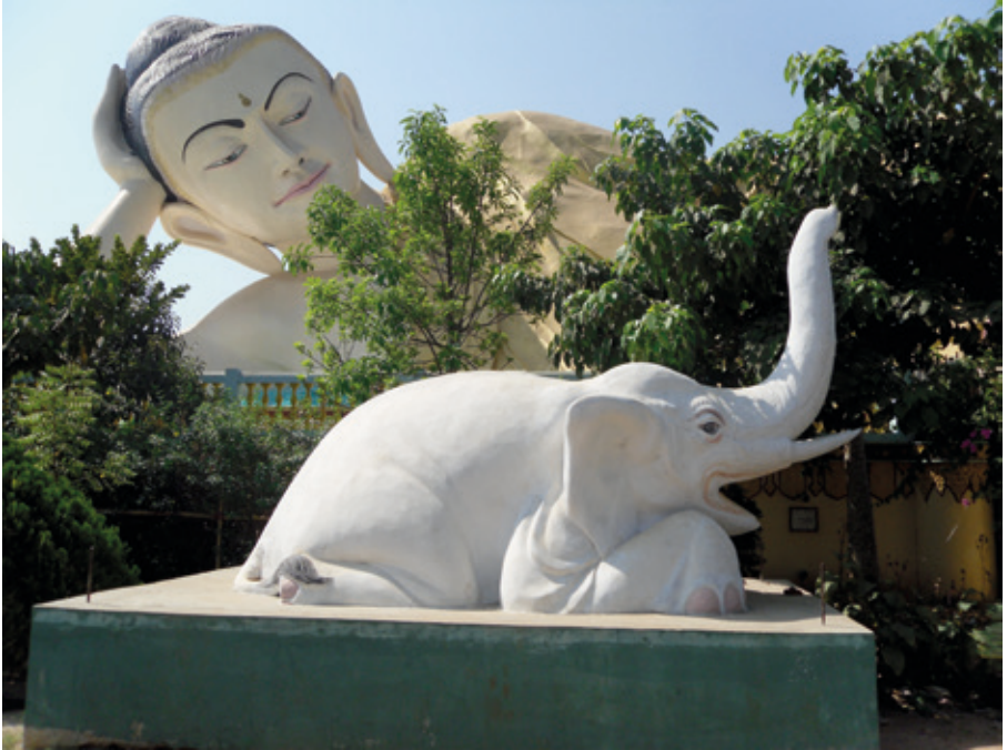
Bago med vackra Buddhor

sarens (!) mausoleum. Efter Seypos-upproret placerade engelsmännen honom i husarrest här c:a 1859. För oss är det häftigt att vara här efter tidigare besök vid mausoléerna för Timur Lenk/ Samarkand, Hamayun/ Delhi, Shah Jahan/ Taj Mahal m.fl. viktiga mogulplatser. Lyckosamt kom en indisk delegation exakt samtidigt när vi var där och lade en exklusiv stor krans på graven. På Zoo tittar vi på flodhästar, tigrar mm. Givet är att titta på Aung Sans monument (general och grundare av ett fritt Burma) liksom att bese muren till dottern Aung San Suu Kyi hus. Shwedagon-pagodan, den finaste i Myanmar, är full av folk, som är där för att be.