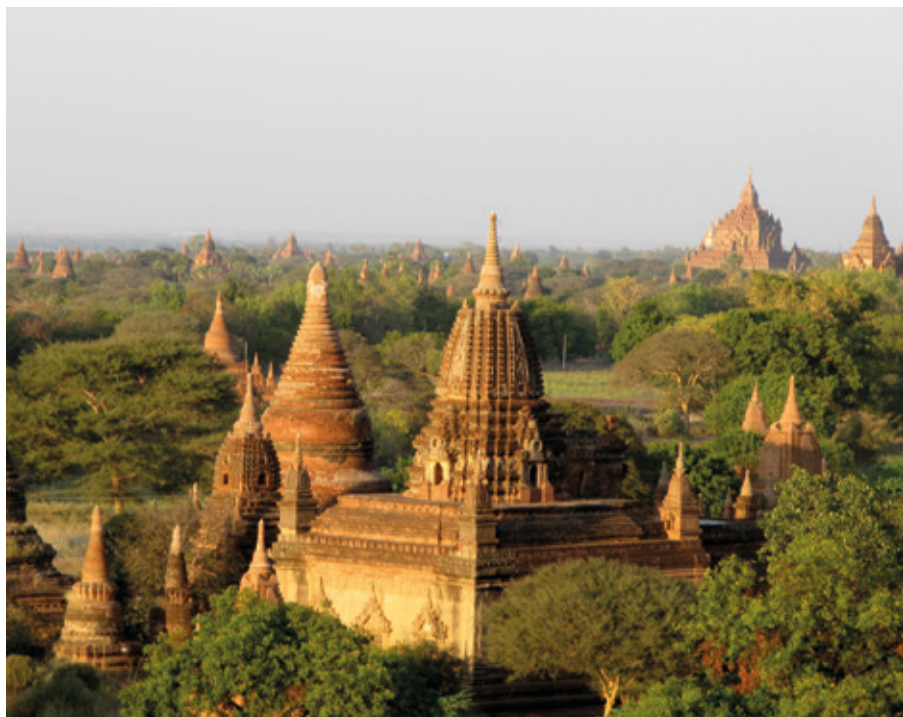
En liten del av alla pagoderna.

Vi ser inga myggor och ännu mindre blir vi bitna. Vi stryker på myggmedel när vi är ute på kvällen och sover i