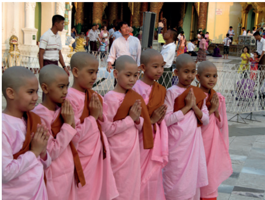
Unga nunnor vid Shwedagon-pagoden.