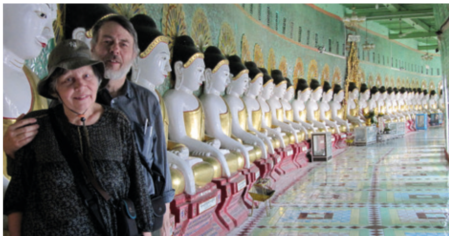
Pagod i Sagaing.

Tidigt på morgonen i mörkret åker vi ner till Irrawadyfloden och går med