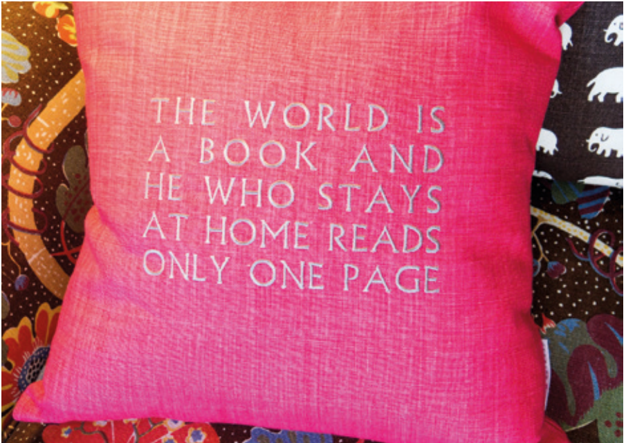
Svenskt Tenn utställningen i Hjo.