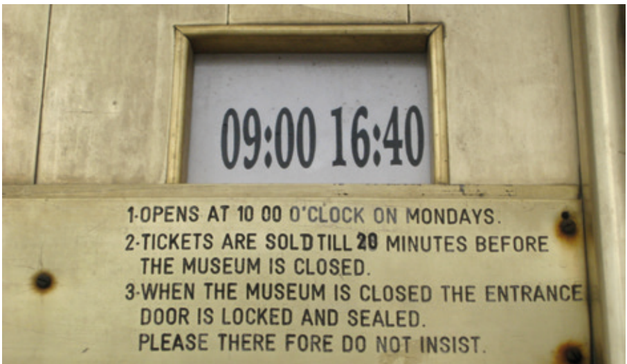
Museets öppettider med förtydligande. Mevlana museum, Konya, Turkiet

Briefing vill gärna ha fler bilder med budskap