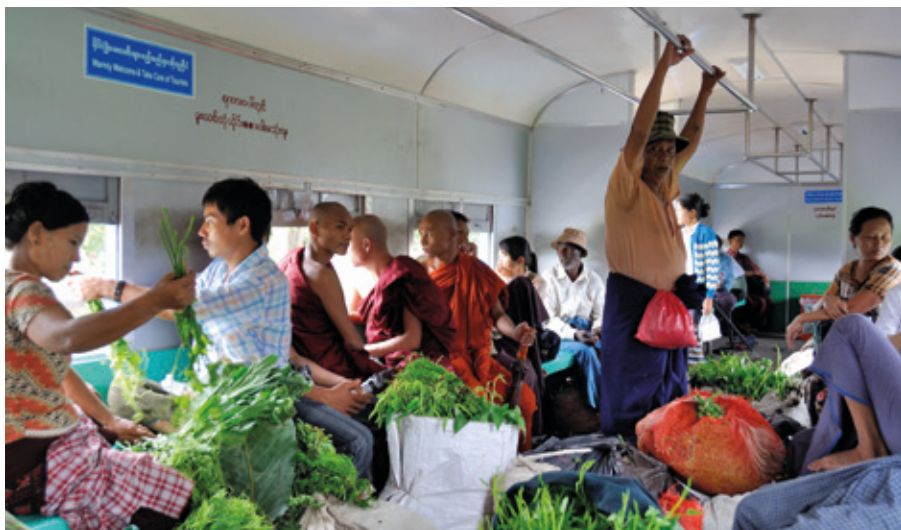
Ombord på tåget är det lite trångt ibland.

som ibland skulle kunna fylla ett helt torgstånd. Vi satt intill en ung kvinna med en stor svart soppåse innehållande vatten och fisk. Påsen läckte och vattnet rann omkring på golvet. I kupén kändes dofter av mat, fisk, örter,