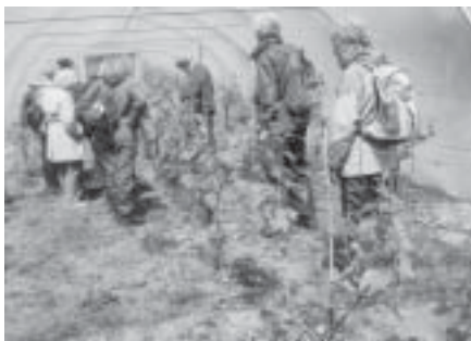
Vinodling på St Martin.