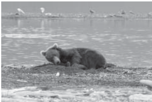
Björnen sover, björnen sover, i sitt lugna bo...

Det blev ett mycket kort besök denna första halvdag i parken, men