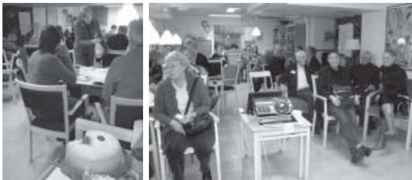
Lördagen den 14 november firade SGS-östra 10 år med tårta och bilder från sydpolen och nordatlanten.

Du köper för att glädja dig själv eller kanske en god vän eller helt enkelt för att säljaren behöver pengarna och gör på det sättet en motprestation. Försök att hitta balansen och pruta med respekt för människan.