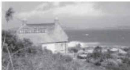
Vy, St Mary.

Veckan ägnades åt utfärder och vandringar på St Mary och besök båtledes till de andra bebodda öarna St Agnes, Tresco, Bryther och St Martin och en