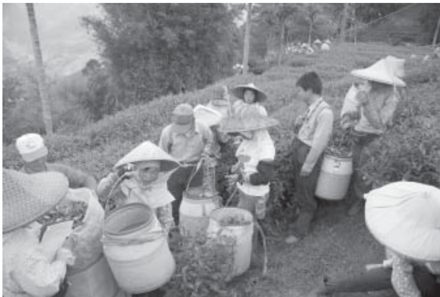
Teplockning i Rueili.

Hualien, styrka 6,3 på Richterskalan) och tyfonerna Morakat och Parma. Bl. a regnade det 1300 mm några mil söder om oss under våra första dagar. Vi fick skippa de östra delarna och ön Lanyu och i stället se mer av de norra och västra delarna.