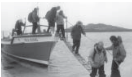
Landstigning på Samson.

Naturen här ute var förbluffande. Palmer växte i nästan alla trädgårdar, det fanns massor av exotiska blommor, jättegernanium, gladiolus, aloe, liljor m.m. Fåglarna var märkligt orädda. Trots den sydländska blomsterprakten kändes det kallt! Kyliga, fuktiga vindar svepte in från havet. Jag saknade mina yllebyxor!!