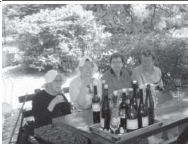
"Så ser det ut när tanterna kommer loss", Donauresan 2008, Bild och text: Monika Apell

När vi på kvällen kom tillbaka till vårt rum efter middagen på lodgen upptäckte