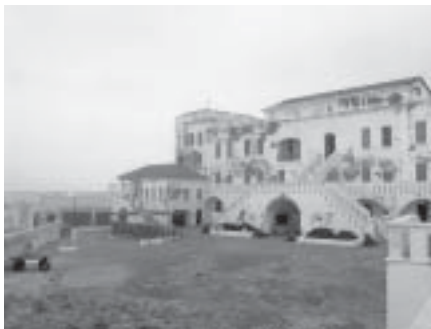
Världsarvet Carolusborg i Ghana.

1. Nordkorea med firandet av Kim Il-sungs födelsedag och möjlighet att förlänga i Sydkorea. Arrangör: Världens Resor. Ledare: Jörgen Fredriksson.