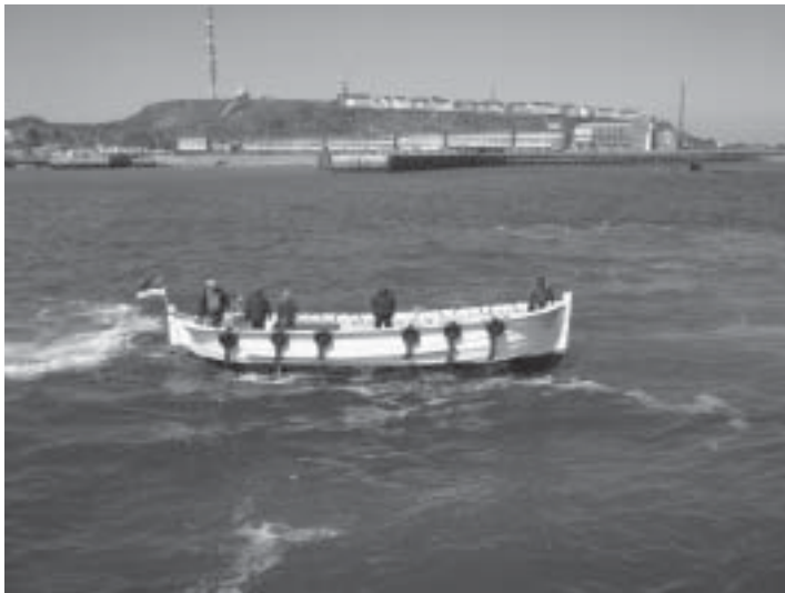
Påminner mig om landstigningarna på Karibienkryssningen.

hang. Under första världskriget evakuerades hela befolkningen, men de fick återvända 1918. Under 1930-talet hade det dåvarande Tyskland stora planer på att anlägga en ubåtshamn på ön, men pengarna och andra världskriget kom emellan.