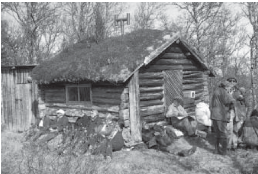
Fika för fjällvandrare.

och altare, ljuskrona, dopfont har växt fram allt eftersom.