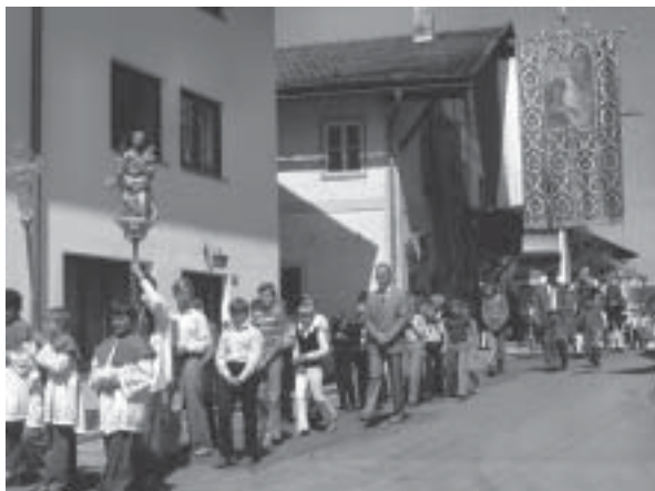
Helgonprocession i byn Axum i Tyrolen