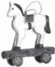
Lokomotiv från Danmark och häst från England.