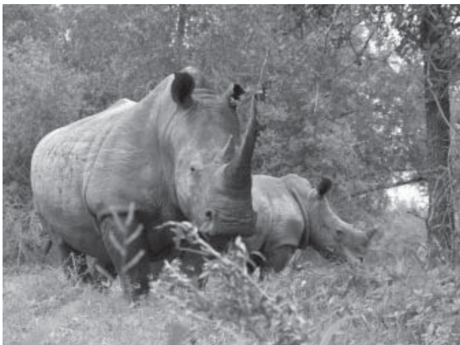
Alldeles för nära!

Att vi senare under samma dag, men då från jeep, fick se ett lejonpars kärleksakt och därefter en stor elefanthanne med "fem ben" rusa efter vår jeep var en storartad och intressant final på en alltför spännande dag.