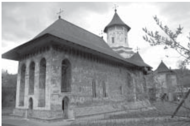
Klosterkyrka från 1400-talet, ett världsarv.

Betryckta lämnar vi den ohyggliga platsen och tar oss ut till "Den lyckliga kyrkogården" Sapanta. Här har varje grav