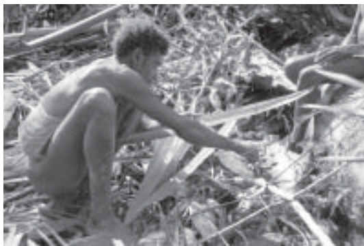
Festvärden plockar sagolarver.

När jag närmar mig festhuset ser jag ett par små eldar som brinner där inne. Ljudet av dansande och sjungande Korowaierna är starkt. De går fram och tillbaka i det 36m långa festhuset. De ogifta männen går sakta och en av dem är ledsångare och sjunger en monoton sång,