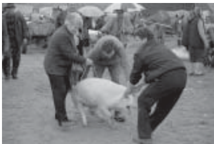
Kreatursmarknaden i Sighet.

Nu lämnar vi Maramures för att ta oss över ett pass i Karpaterna till den Moldaviska delen av Rumänien. Vi har sett världsarvskyrkor av trä tidigare men