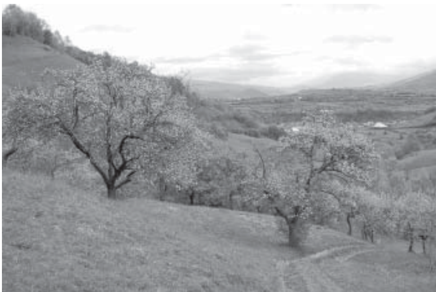
Vacker och lättgängen natur.

Det är Världens Resor som på ett alldeles utmärkt sätt planerat och genomfört denna intressanta resa med oss 10 helsingborgare.