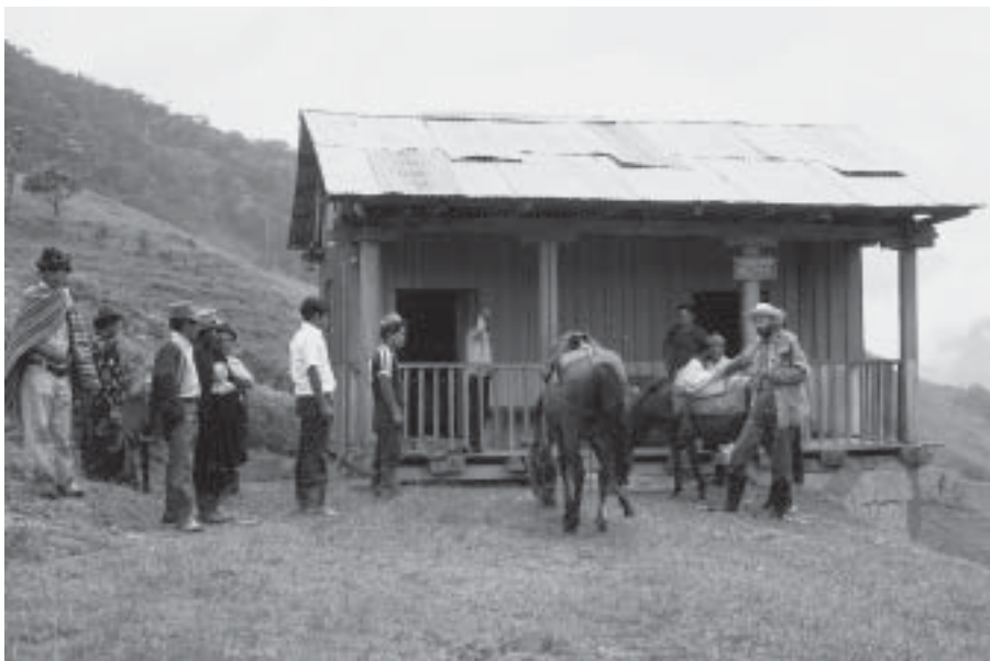
Författaren i Cuyesdalen.

området omkring 1970, har ytterligare tre landsvägar anlagts, med följande kolonisation av "colonos", fattiga nybyggare från höglandet uppe i Anderna.