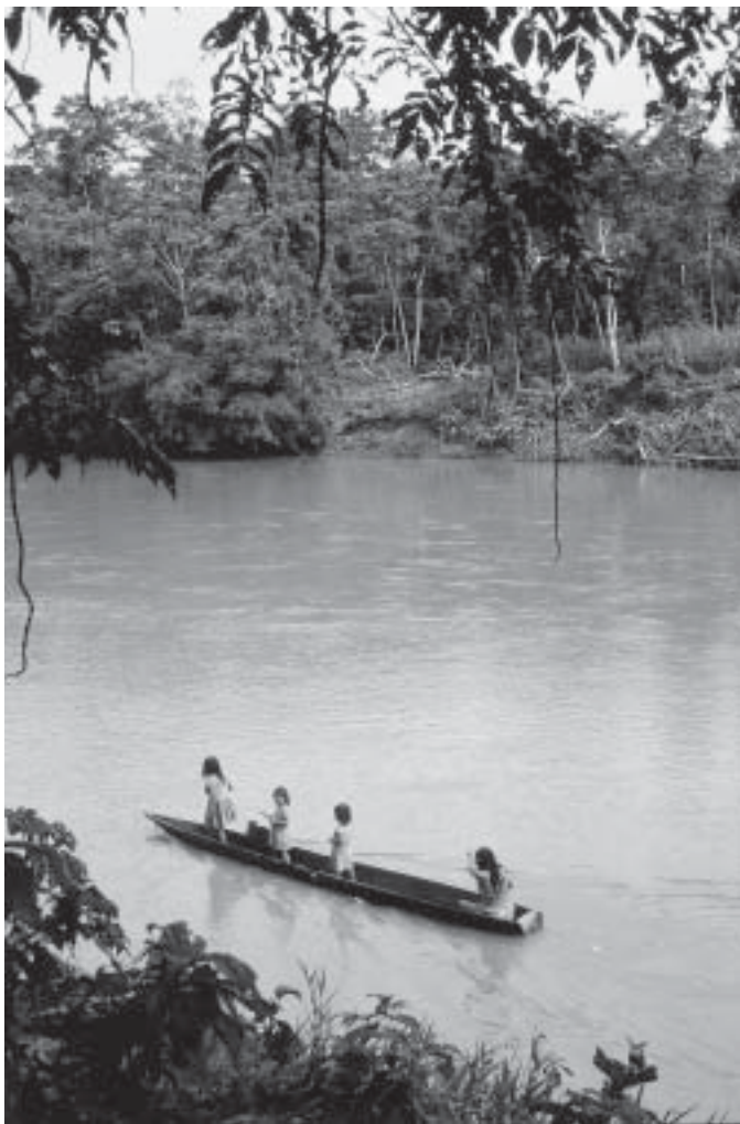
Indiankanot på Rio Bobonaza.

Chichirota. Några av invånarna mötte nyfiket upp. De vuxna männen hade håret klippt halvlångt eller kort, ett tecken på påverkan från de vitas civilisation. Övriga invånare hade håret hängande fritt långt ned på axlarna. Flera var klädda mer eller mindre som vita, men alla var barfota, utom ett par män med gummistövlar. Det första huset jag såg var byns skola, det typiska, till formen ovala jivarohuset av chontaträ, bambu och tak av palmblad. Fyrsidiga hus förekom också. I ett vägglost sådant hus högt över floden skulle vi härbärgas några dagar.