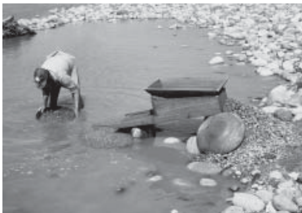
Guldvaskning nedanför bergen.

vägen sänkte sig, ändrade landskapet karaktär från det torra höglandet till det varmare, fuktigare låglandet med allt frodigare grönska. Snart hängde bergsregnskogen ut över vägen med färggranna klasar av blommor och stora, fladdrande fjärilar i luften. Högt över den trånga dalen, osynlig från vägen, ruvade den 5 000 meter höga, aktiva vulkanen Tungurahua med sin perfekta konform. Bäcker kastade sig i vattenfall nedför stupen. Snart vidgade sig dalen och floden lugnade sig märkbart. Nu öppnade sig hela det väldiga Amazonas framför oss, världens väldigaste regnskogsområde. Här i Ecuador kallas området "El Oriente", Östern, och hit ner fanns länge endast denna väg längs Pastazafloden. Sedan olja upptäcktes i