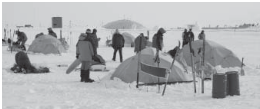
Turisterna har anlänt till Antarktis.

Av arbete blir man hungrig så sedan var det dags för matlagning. Men det fanns ett hinder som måste övervinnas, att få fart på nödköket trots att bränslet hade övergivit sin normala flytande form och var mer en gelé. Det blir det när det är riktigt kallt. Instruktören hade ett fungerande tips för detta också. Stoppa in flaskan under kläderna och värma den och är det riktigt kallt så det inte fungerar så är det bara att tutta på och värma upp. Vet inte vad säkerhetsmedvetna svenskar säger om den idén, men uttröt-