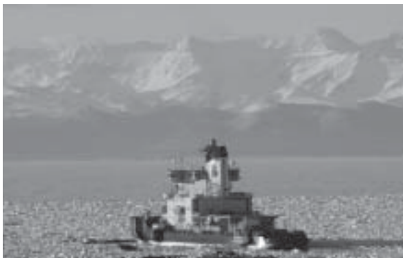
Isbrytaren Oden på besök.

tad och hungrig så var det bara att lyda, dessutom så fungerade det.