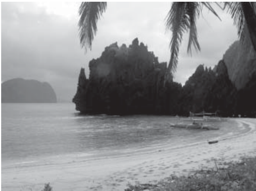
Bacuitarkipelagen på Palawan.

sto längre i tid. Och tiden började ta slut. Nu var goda råd dyra. Nej, inte så dyra egentligen. Kom överens med en taxi-chaufför i bergsstaderna Baguio om en tredagarstur för ca 70 USD/dag för transporten. Och vägarna var verkligen dåliga första två dagarna. Medelhastigheten var kanske bara runt 20 - 30 km/timmen och underredet av bilen skrapade ofta mot "vägen". En jeep med högre frihöjd till vägbanan hade nog varit att föredra. Men att det gick sakta gjorde inte så mycket, för landskapet var oerhört naturskönt. Nåväl, kom fram så småningom och terrasserna var verkligen fantastiska. Det är onekligen imponerande att man för 2 000 år sedan har kunnat bygga risterrasser i denna terräng, vars lutning kan jämföras med störtloppsbackar.