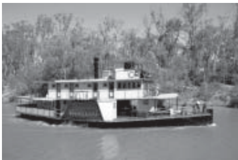
Hjulångare på Murray River.

Förra helgen var långhelg, Australiens nationaldag, Australia Day, inföll på fredagen. Här blir man ofta medbjuden på de mest varierande arrangemang, - vi svenskar har mycket att lära om hur man ska ta hand om främlingar! Vi säger JA TACK till det mesta, så vi har blivit fan-