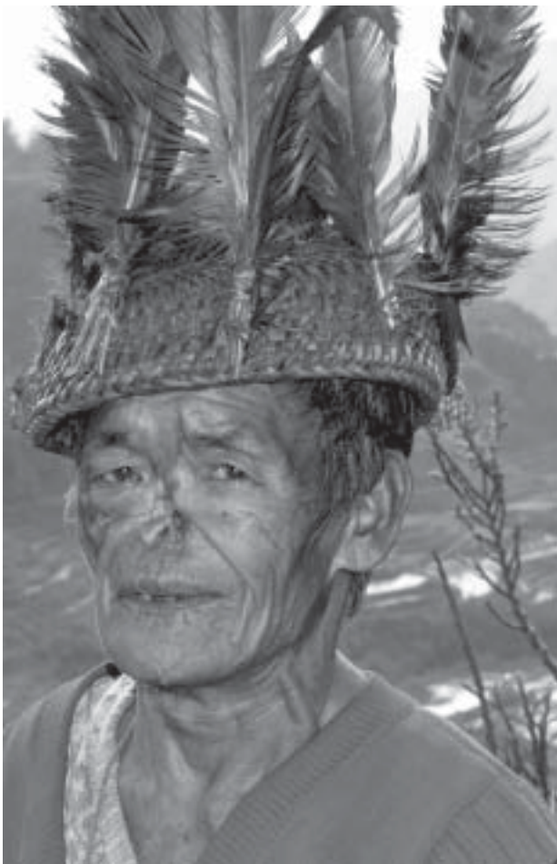
Ifugaoman i Banaue.

gelbundna färjekatastrofer, den islamistiska gerillarörelsen Abu Sayyaf, som kämpar för frigörelse och bildande av egen muslimsk stat i södra Filippinerna, samt storstaden Manila med dess rykten om kriminalitet. Tyfoner och jordskred fick vi ju också en påminnelse om veckan innan avfärd, då ihållande regn över östra Filippinerna förorsakade kraftiga jordskred på sluttningarna runt vulkanen Mt Mayon, vilka orsakade att omkring 1 000 personer omkom. Så den delen av landet undvek vi. Likaså södra delen av landet med anledning av ovannämnda gerilla. Jag trodde också att landet med sin katolska prägel, även skulle ha en del av den latinamerikanska tuffheten, men inte, det var den sedvanliga asiatiska hjälpsamheten som