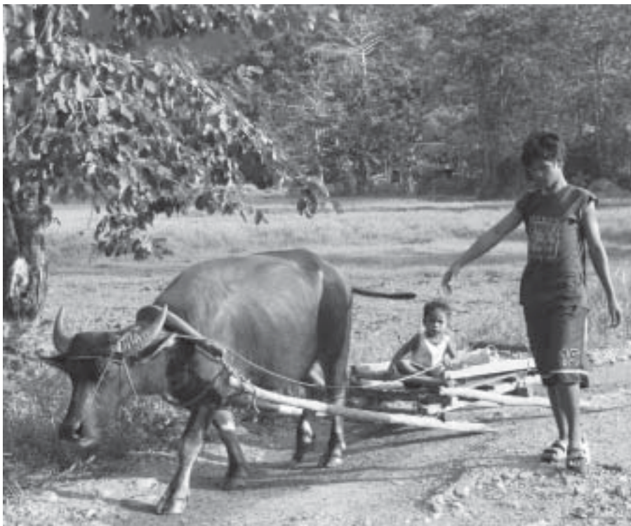
Det ska börjas i tid! Nära Sabang på Palawan.

som att åka jeep i "Flumeriden" på Liseberg. Men till slut blev det för smalt och brant även för jeepen och vi fick då en mycket fin vandring på några timmar genom vulkanlandskapet där man hela tiden såg lämningar av den stelnade lavan. Väl igenom krateröppningen visade sig en sagolikt vacker syn i form av kratersjön med sitt turkosa vatten omgiven av flera hundra meter höga kraterkanter. Och badet i sjön var härligt.