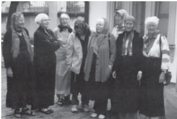
I rysk ortodox kyrka måste alla kvinnor ha lång kjol och något på huvudet

Vår resa med Pär Lindström i augusti 2006 till Lettland och Estland på längden och en snutt in i Ryssland blev en intressant upplevelse med mycket kultur och historia.