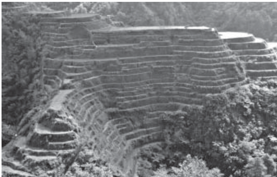
Risterrasser i Banaue, ett världsarv.

Ett av målen med resan var också risterrasserna omkring den lilla staden Banaue på det inre av huvudön Luzon. Dessa är ett av flera ställen i världen som ibland benämns som världens åttonde underverk. När vi började att mera i detalj studera guideboken blev vi dock uppmärksamma på att även om inte avstånden var så långa i km, så var de de-