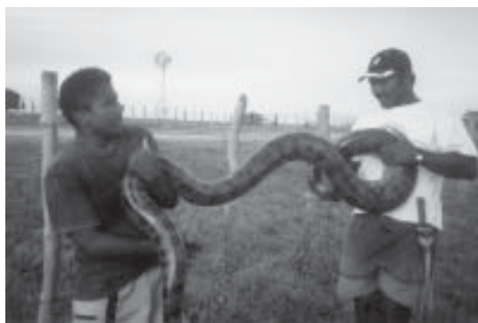
Denna anakonda såg vi Los Llanos.

Det återstod bara flyg till Ciudad Bolivar och sedan flyg till Sverige.