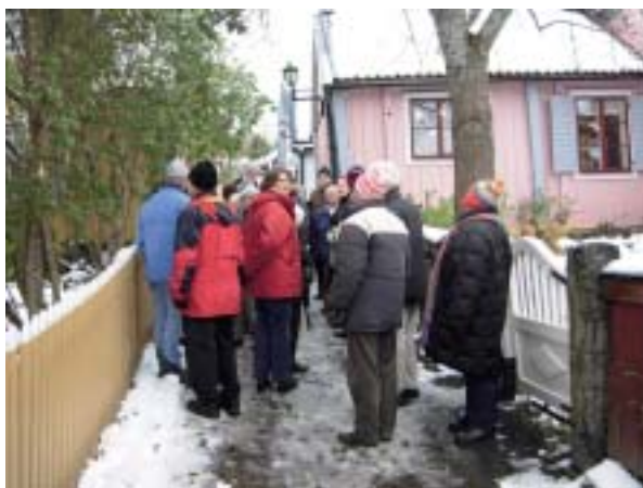
På guidad tur i ett snöslaskigt Sigtuna.

Traditionsenligt följde: ”Visning av egna bilder”. Jag tänker inte recensera varje