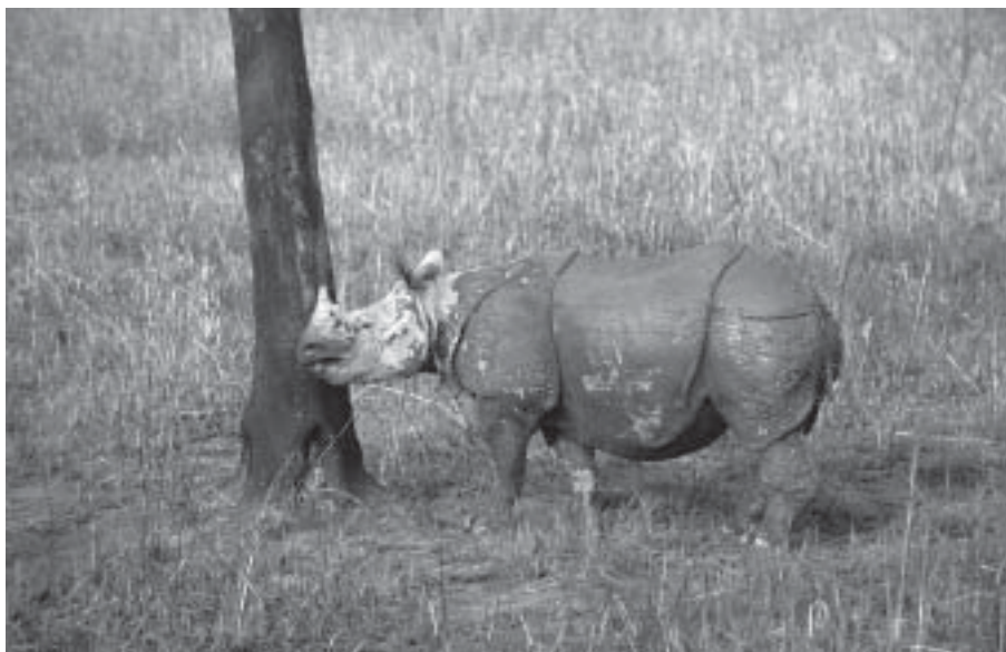
Pansarnoshörning, Kaziranga Nationalpark.

Den här morgonen ser vi många pansarnoshörningar. Urtidsdjur med ett säreget utseende. Stora och med ett värdigt beteende. Bufflar och hjortar rör sig också i det höga elefantgräset. Det är ett attraktivt nöje för oss besökare och i dagens safari deltar åtta elefanthonor och fyra busiga elefantungar som ystert springer runt i flocken. En av ungarna busar så mycket att mammorna börjar trumpeta och vi får höra att detta busfrö är barn till vild elefantpappa som