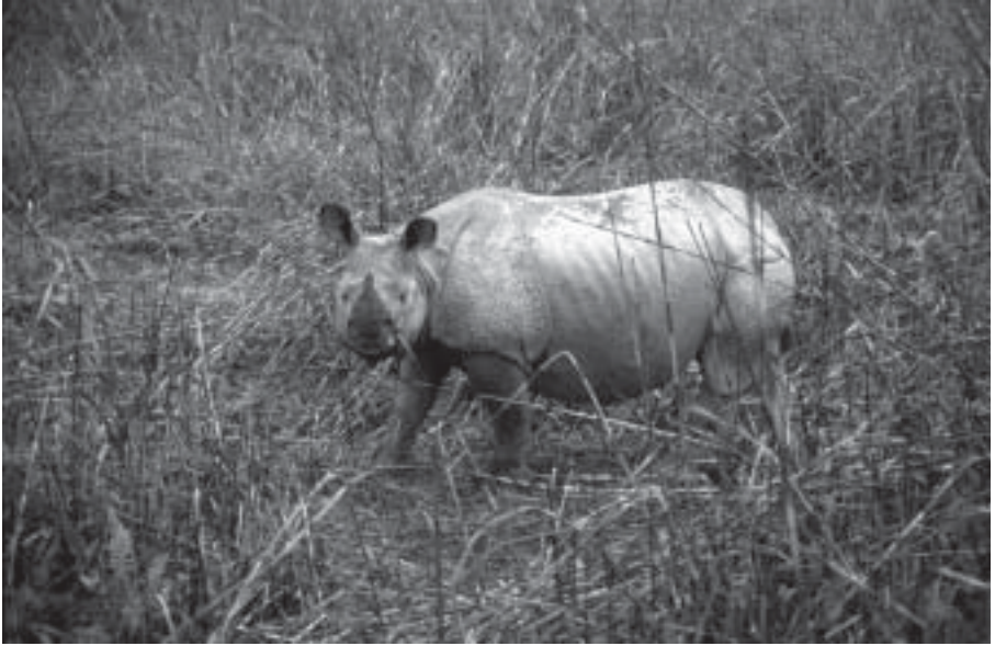
Ung pansarnoshörning, Kaziranga Nationalpark, tidigt på morgonen.

hittat in till honflocken en mörk natt. Romantiska sammanträffanden förekommer där man minst anar det!