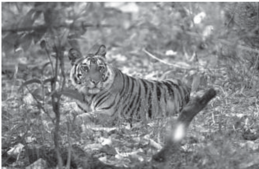
En ung tiger i Bandhavgarh Nationalpark som ligger och väntar på att parken ska stänga för dagen så att det blir lugnt i parken.