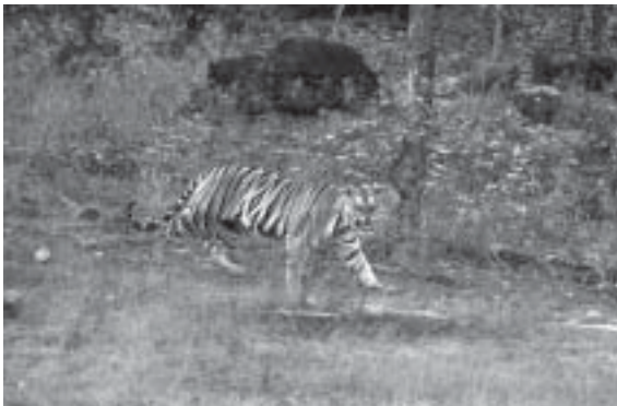
Tiger hona i Bandhavgarh Nationalpark som väser åt oss innan hon passerar över vägen framför vår Jeep på väg till sina fyra ungar efter morgonens jakt.

Då skall vi upp lika tidigt igen och rida elefant i gryningen. Säkert kommer vi att se fler pansarnoshörningar. Sedan skall vi också vandra i djungeln i hopp om att få se gibbonapor. Vi vet att vi kommer att utrustas med blodigelskydd i form av långa benskydd med fot. Det blir en ny spännande dag med massor av timmar bland djuren i parken.