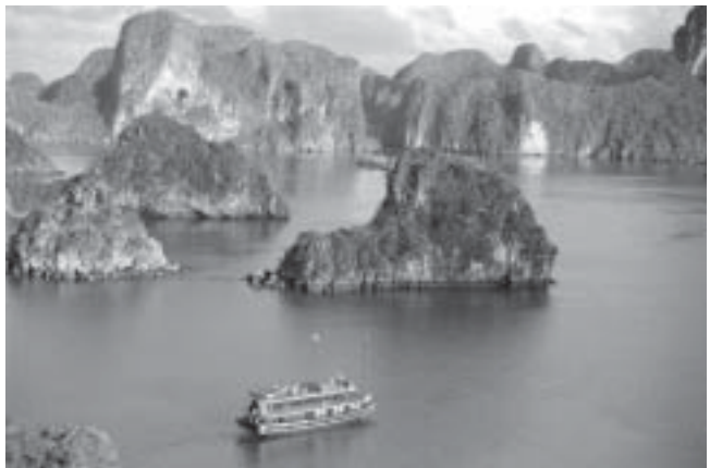
Det vackra Halong Bay.

När vi har besökt kungaslott och gravar i den gamla kejsarstaden Hue, som också står på Världsarvslistan, bär färden vidare till Hoian. Där finns den alldeles förtjusande och intressanta "Gamla staden" även den på Världsarvslistan. Där inne är biltrafik förbjuden men motorcyklar accepteras. Vi bor på ett hotell med ett rum möblerat med antikviteter och en balkong mot gatan. Där sitter vi på kvällen med ett glas vin och ser staden stängas. Butiksinnehavaren sätter för bräddor i spår på dörröppningens sidor. Motorcyklar kommer och hämtar de vackert klädda expediterna som glatt sätter sig på bönpallen. Skymningen kommer så sakta och vi störs inte av att en stor rätta springer över balkongen på huset mittemot. Städerskan har lagt ett