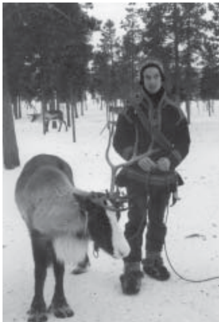
Same med ren.

Vi anländer dit lagom till en guidning för oss som ska övernatta. Vilket imponerande bygge! Snabbt går det också eftersom väggar och tak består av konstsnö, som man sprutar på färdiga formar. Har man råkat överboka är det bara att ställa ut formarna och köra igång snökanonerna och lägga till några rum.