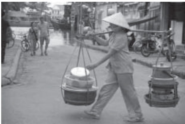
Hoi An där översvämningarna kommer varje år, det är bara att notera hur högt det blir i år.

Saigon eller Hô Chi Minh City, båda namnen används, tar emot oss med sina 6 milj. motorcyklar. Vi lär oss att gå sakta över gatan inte stanna så fungerar det. Vi har överlevt flera sådana övergångar. Staden är vacker genom att den är grön, den har så många gatuplanteringar. Ett måste vid ett besök här är naturligtvis att se de gångar och underjordiska rum där motståndsrörelsen levde under Viet-