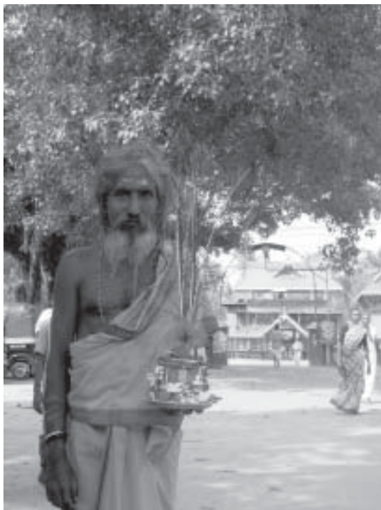
"Helig man" samlar allmosor inför tempelfesten.

skräddaren stack fram sitt huvud fick han en rejäl dusch. Man ska inte göra en elefant något förnär. Den har ett enastående minne och kan hämnas.