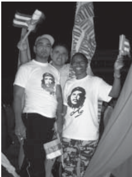
På revolutionsplatsen i väntan på Fidel.

Att åka på egen hand var lättare än vi trodde. Transporter fixade sig på ett eller annat sätt. Fanns det ingen buss gällde det att förhandla med en taxichaufför för egen transport. Annars gick det bra att hyra cykel eller motorcykel. Boendet var ännu mer lättfixat. De slogs om oss! Vi valde att bo i familj (på små familjepensionat) hela tiden, vilket blev mycket lyckat. Det är ett bra sätt att komma i kontakt med det kubanska folket och också ett trevligt sätt att bo. Standarden var utmärkt och vi valde ofta att äta hos våra familjer också. Maten ja. Hade väl tänkt oss att någon gourmetresa skulle det inte bli, här gällde det bara att överleva. Vi tog fel. För med mesta fick vi jättebra mat, långt över förväntan. Dock med en viss nervositet. De stackars familjerna som hade förmånen att hyra ut rum var hårt kontrollerade. Fisk och skaldjur skulle inte serveras privat utan det var reserverat för restauranter och för export. Men våra familjer gjorde undantag. Skulle någon kontrollant dyka upp (vi hade en på