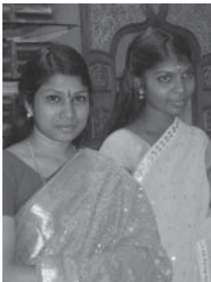
Indiska flickor i Ernakulam.

En grå dag i mitten på november skedde utresan. Tre veckor fyllda av härliga upplevelser, möten med människor och även vilda djur. Det borde finnas doftande papper för att riktigt kunna förmedla känslan av en resa till Indien. Lukten av kryddor blandat med oset från små eldar utmed vägen där papper och bråte bränns med kokospalmblad har etsat sig kvar.