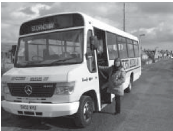
Förlöst fordon i Port Ness

Vi vandrar tankfulla ytterligare en runda i den lilla staden. Gatubelysningen tänds och pubarna lever upp, som överallt i