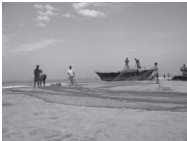
Fiskare ser över sina nät i Colva, Goa.

Kerala ligger långt över Indiens genom-snitt med en läskunnighet på 98% och med en väl utbyggd skola och sjukvård. Mycket sägs bero på kommunistisk politik under decennier. Jordbruk med odlingar av kokosnötter, ris, kryddor, gummi, te och kaffe gör Kerala till en välmående delstat.