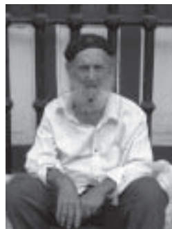
Gammal revolutionär i Havanna.

Bolivia skall utrota analfabetismen och höja standarden på sjukvården med kubansk hjälp. Hjälpinsatser är skickade redan. Naturligtvis delades det ut kängor till den mäktige grannen USA. Vi hade också i början av vår resa stoppats av en protestmarsch mot USA, där uppskattningsvis en miljon människor vandrade iväg med Fidel i spetsen och med ett avstängt Havanna som följd.