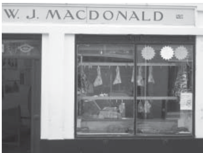
Lokal variant av känt varumärke. Stornoway

Vi går ut och äter på en pub med dartkastande ungdomar. Då vi åter kommer ut på gatan möts vi av en rejält kyllig kvällsbris och vänder långsamt hemåt genom staden. Vi möter Willem, som vi sätter oss och språkar med. En lätt disharmonisk bild tonar fram kring en ung, lovande banktjänsteman som flyttat till Midlands från Holland för ett par år sedan för att arbeta i finanssektorn. Hälsan gick över styr och sedan i somras