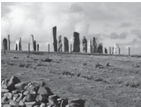
De resta jättarna i Callanish, Isle of Lewis.

någon timma senare, men vi kommer redan samma dag att göra fler buss-