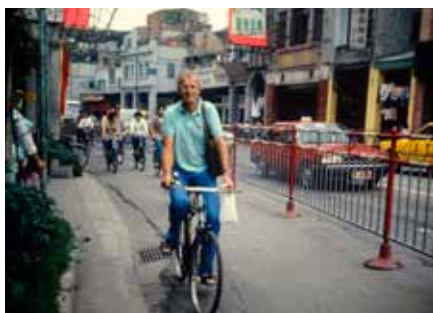
På cykel i Guangzhou

Från Hongkong fick det bli tåg till första anhalten i fastlands-Kina, Guangzhou (Kanton). Där rekommenderade Lonely Planet ett bra hostel för back-packers (och som sådan betraktade jag mig inledningsvis) och det fanns anvisningar hur man