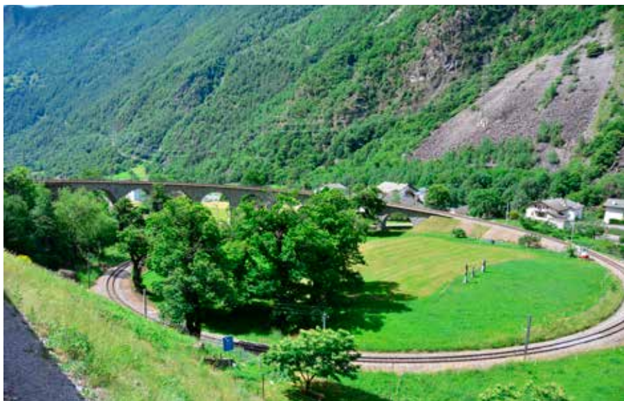
Brusico Circular Viadukten

vårt paket, däribland Lugano. Vi tog en fin promenad i stan och hittade en japansk restaurang, som hade en av våra favoriter, tempura, på menyn.