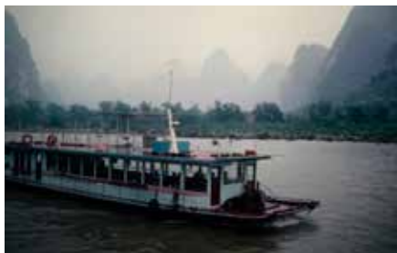
Längs Li-jiangfloden i hållande regn

För att få ett flyg till Xian till rimligt pris måste jag stanna en extra dag i Guilin. På så vis fick jag tillfälle att besöka några fantastiska, konstfullt illuminerade grottor strax utanför stan.