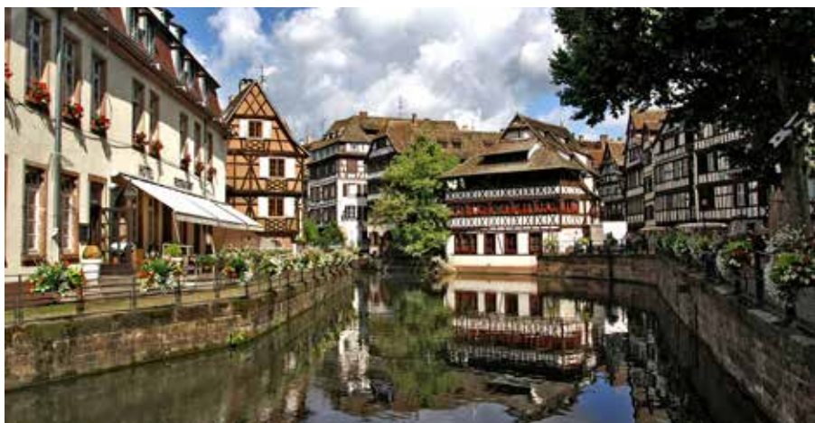
I det vackra La Petite France, det historiska kvarteret på ön Grande Ile och en del av Unescos världsarv, kan man slå sig ner på något av de trevliga utecaféerna för att beundra de små korsvirkeshusen i typisk alsacestil från 1400- och 1500-talen.

ledning att besöka Bonn, som vi ska besöka och som i flera år fortsatte att vara det enade Tysklands huvudstad. Som Europakorrespondent har han även besökt Alsace och Strasbourgs oräkneliga gånger, Strasbourg som fransmännen