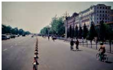
Gott om plats för cyklister i Peking

I Beijing var biltrafiken ännu påfallande sparsam, så det kändes lägligt att ta sig runt på cykel. Att ta sig ända till Sommarpalatset på cykel kändes dock lite vanskligt, så det fick bli buss dit ut. Jag ställde cykeln bland tusen andra, nära busshållplatsen, och for iväg. Det var söndag och vackert väder, så jag var inte direkt ensam om att söka rekreation och svalka där ute. När det var dags att åka tillbaka till Beijing var busstrafiken beredd på anstormning och den ena bussen efter den andra fylldes på ett ögonblick.