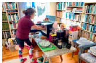
Tillfälligt "kök" i biblioteket med kaffebruggare, vattenkokare och mikrovågsugn som enda matlagingsmöjlighet – och diska fick vi göra i duschen.

Sist och slutligen vill jag uppmana er alla att värva många nya medlemmar, skriva om era äventyr och upplevelser i Briefing och naturligtvis att ha en lång och skön sommar och så ses vi igen i höst!