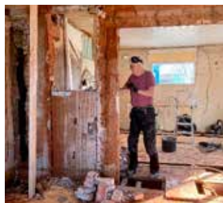
Här var det nog som värst, uppbrutet golv, bärande vägg på väg att tas ner och bara bråte, sågspån och tegeldamm överallt.