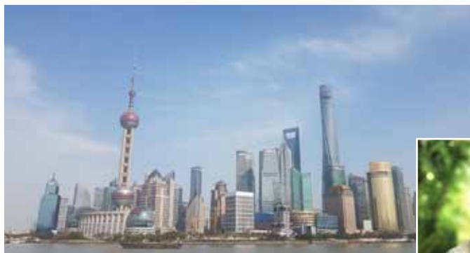
Shanghai dit vi anländer med tåg och sedan tar färja över till Osaka där vår transasiatiska tågresa fortsätter.

Resan är planerad under perioden då taifolken tackar vattengudinnan för regnperiodens vatten till rismarkerna, vilket firas med den graciösa Loi Krathongfestivalen. Flytetyg med blommor och stearinljus driver på floderna och ljuslanternor lyser upp himlen. När vi cirka tre veckor senare anländer till Japan "brinner lönnarna" och höstfärgerna är normalt sett som vackrast.