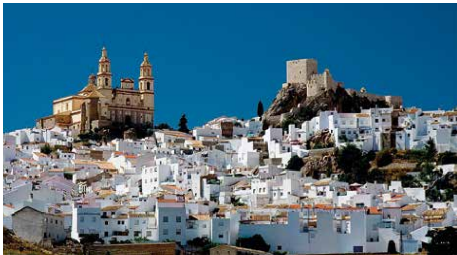
Cadiz, västlandets äldsta stad.