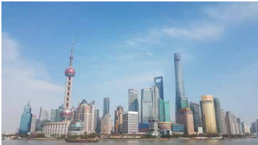
Shanghai varifrån vi tar färjan till Osaka.