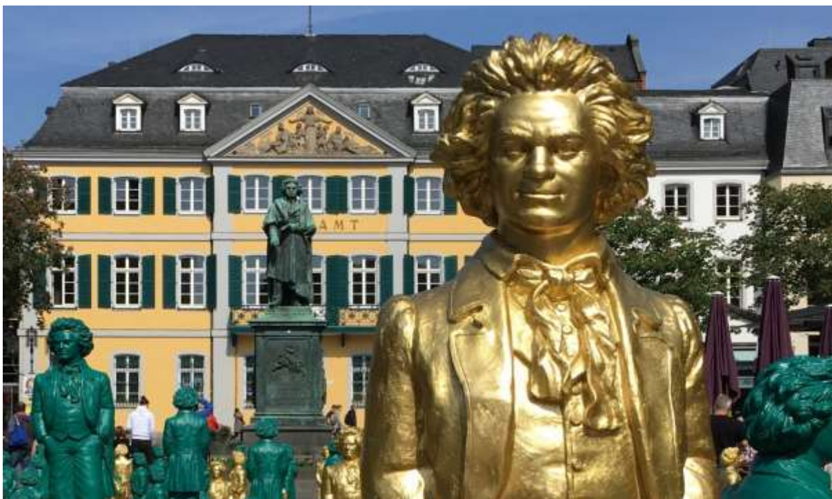
Ludwig van Beethoven föddes 1770 i Bonn och på Münsterplatz står han staty.