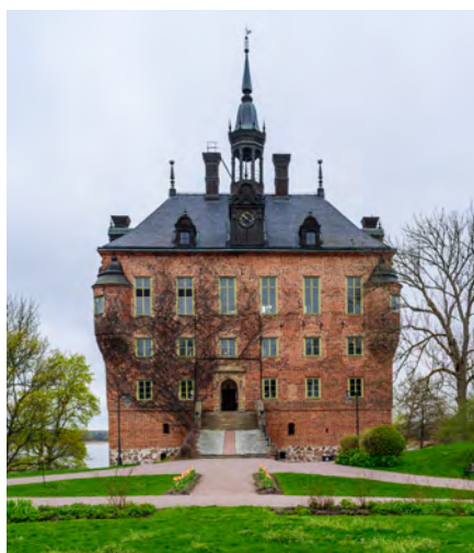
Wiks slott.

Resan bjuder på en härlig kombination av praktfulla miljöer, vackra trädgårdar, god mat och minnesvärda möten. Vi besöker bland annat det sagolika Stora Sundby slott, det välbevarade Tidö slott och historiska Örbyhus slott, känt för berättelsen om Erik XIV. Längs vägen njuter