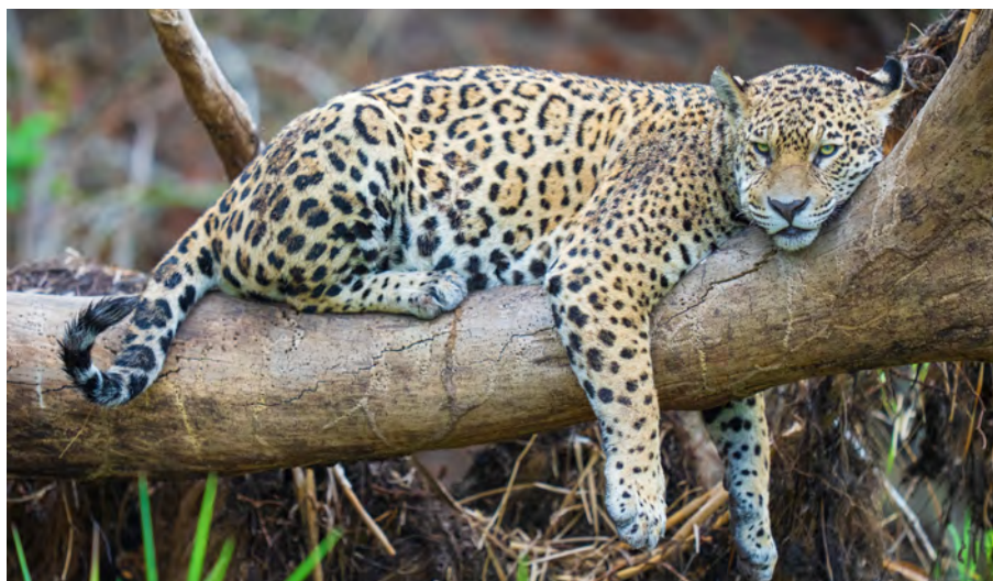
Pantanal är en av världens bästa platser för att se jaguarer på nära håll.