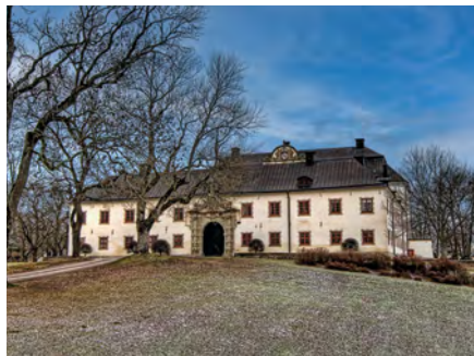
Tidö slott. Bilden är AI-redigerad.

vi av luncher i inspirerande miljöer och får tid att upptäcka allt från konst och inredning till lokala delikatesser.