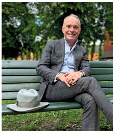
Med på resan är Peder Lamm, svensk antikekspert, TV-profil och föreläsare. Han arbetar med att värdera antikviteter och att sprida kunskap om historia, konst och kulturföremål. Peder är en mycket uppskattad ciceron.

Varmt välkommen att följa med på en resa fylld av historia, kultur och slottsmagi!