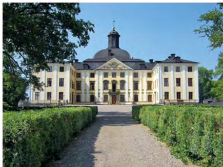
Örbyhus slott.