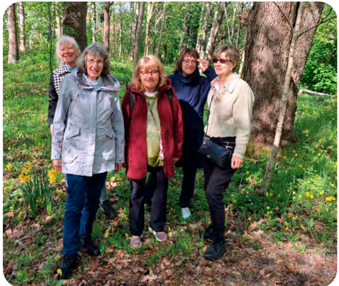
Ett gäng förväntansfulla damer inför vårmötet.