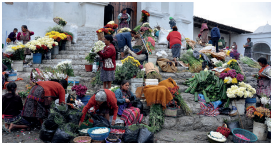
Kyrktrappan i Chichicastenago