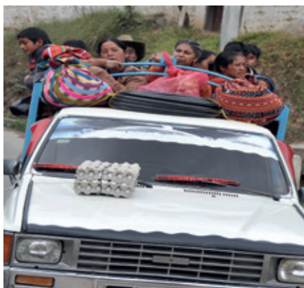
Om det är fullt i bilen får man ha äggen på motorhuven

Guatemala gav många oförglömliga minnen och intryck med den gamla maya-kulturen, de mäktiga vulkanerna i det omväxlande landskapet, de uttrycksfulla människorna och alla de iögonenfallande färgerna som fanns överallt.