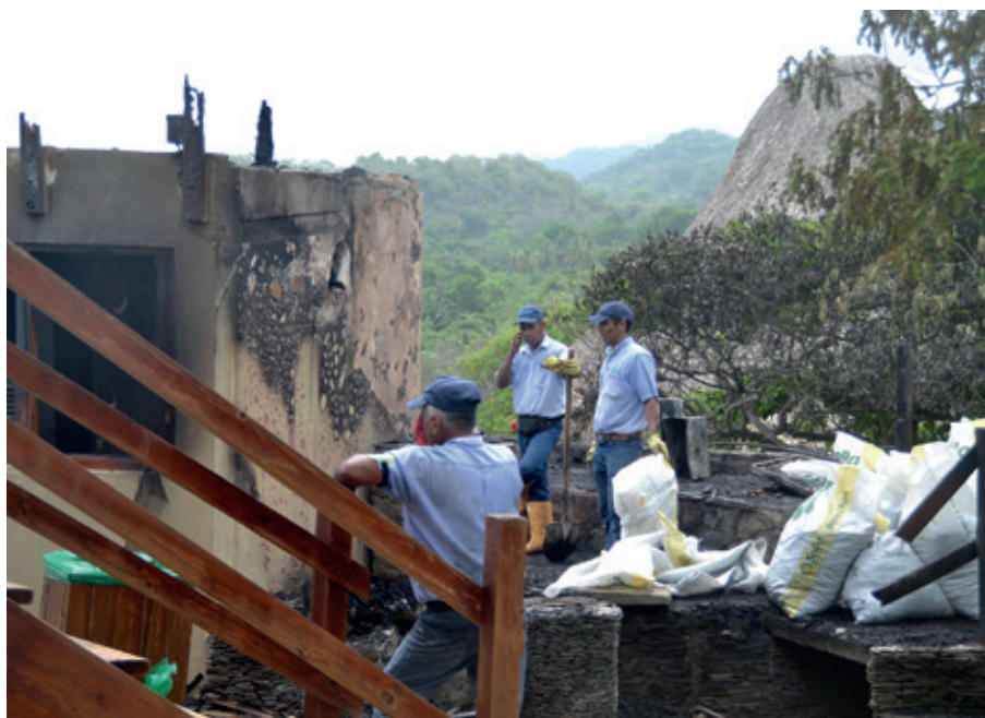
Den nedbrunna hyddan.