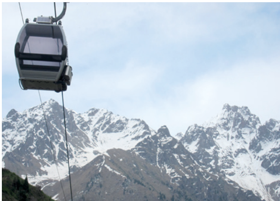
Kabinbanan till skidorten Chimbulak.

Majoriteten av kazakerna är liksom kirgizerna ett muslimskt turkfolk. Tolkningen av islam är liberal och vi såg inga kvinnor bära slöjor. Enligt författningen är Kazakstan en sekulär stat som garanterar religionsfrihet, men i verkligheten förekommer inskränkningar i friheten. Efter Sovjetunionens kollaps förklarade