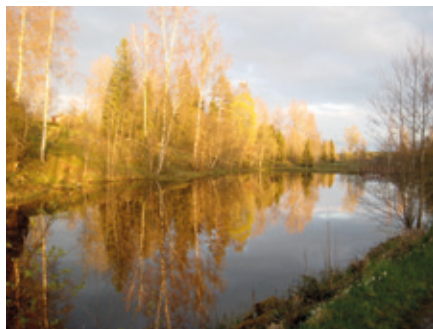
Rastälven i kvällssol.

(Dikt vi hittade i Nyhyttan på en foto- utställning om kurortslivet)