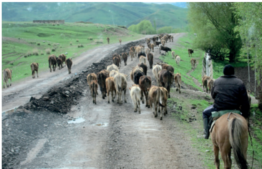
Vägen över bergen vid gränsstationen i Kazakstan.

vi lämnade området såg vi också en flock jakar som rörde sig högt upp i bergslandskapet.