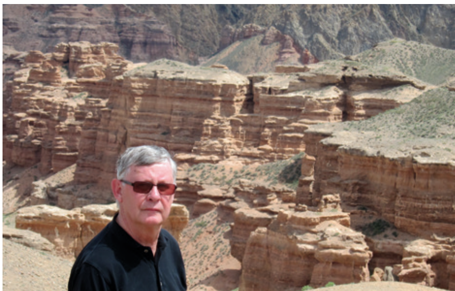
Författaren vid Caryn Canyon.