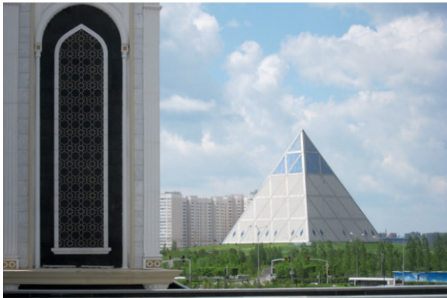
Fosters pyramid för fred och försoning.

skyfall och på vägen till hotellet fick vi erfara att delar av staden var avstängd till följd av översvämningar.