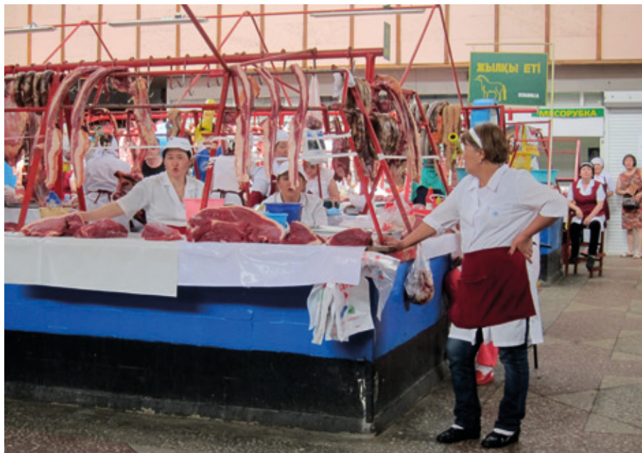
Stort utbud på hästkött på marknaden i Bisjkek