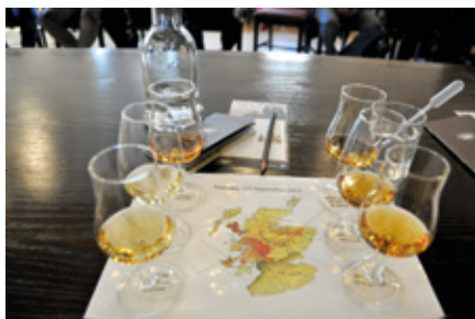
Dukat för whiskyprovning.

I september 2014, när det var valrörelse både i Sverige och Skottland, tillbringade vi tre hela dagar i Skottlands whiskydistrikt. Vi bodde på B&B i den lilla staden Pitlochry, som har fått flera utmärkelser för sina vackra parker och blomsterarrangemang. Där bor 2 500 innevånare och där finns hela 10 500 gästsängar. Vi som inte hade varit där tidigare fick en möjlighet att gå en guidad tur klockan 7 på morgonen en av dagarna, dvs. före frukost. Från Pitlochry gjorde vi dagsutflykter och vi hade ett späckat program. Det var inte bara whiskyprovning på agendan. Vi började med att besöka Skottlands mest kända slott, Blair Castle, som tronar mitt på sina stora ägor. Nästan alla väggar där är helt klädda med vapen och hjorthorn. Under rundturen stannade vi också vid Queens View, det mest kända vykortsmotivet från området. Man ser ner över en flod som ringlar sig fram. Vår ambitiösa värd försåg oss varje morgon personligen med rejäl skotsk frukost bestående av en välfylld tallrik med två stekta ägg, korv, baconskivor, stekta champinjoner, tomat, black pudding och haggis. Därutöver fanns förstås ett antal olika sorters flingor, frukt, mjölk, yoghurt, marmelad, bröd av alla de slag, kaffe och te. Ja, det var nog inte så dumt eftersom vi ibland gick direkt från frukostbordet till bussen och åkte till ett whiskydestilleri. Det behövs mat i magen om avsmak-