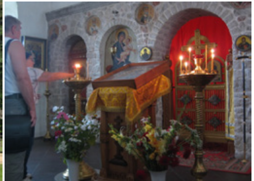
Klosterkyrka i Pskov. Ryssland.