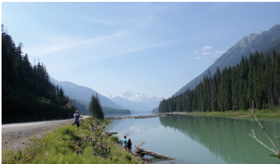
Duffy Lake, British Columbia.