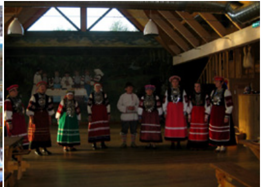
Folkdanser av Setufolket, Estland.