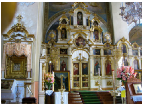
Pühtitsa kloster, Kuremäe Estland