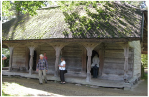
Besök i Gammaltroendes bönehus, Riga. Lettland. Etnografiska friluftsmuseet Riga