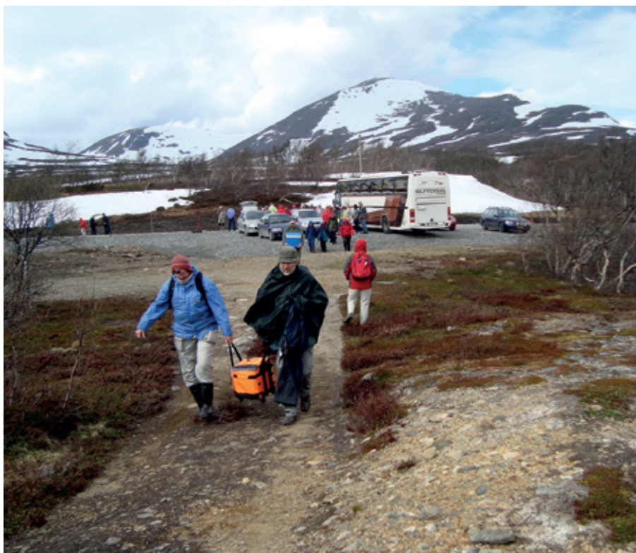
Lunch på fjället. Jämtland, maj 2009.

are, även om det ibland blev lite tja- tigt, då det behövdes material i form av reseskildringar till tidningen. Det var inte alltid som sådana fanns på lager. Utan medlemmars medverkan blir det ju ingen tidning. Jag måste berömma tryckeriet i Nora för ett utmärkt samarbete under mina år som Briefingansvarig.