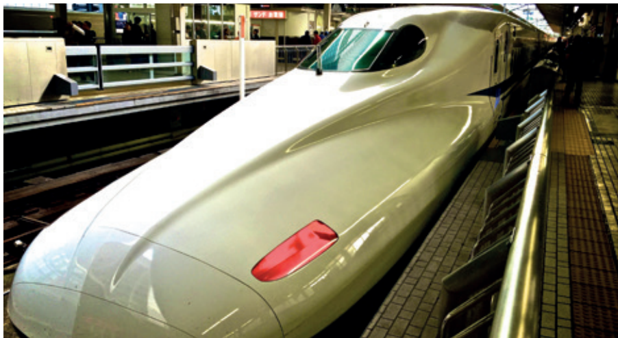
Shinkansen (shin=ny och kansen=tåg).