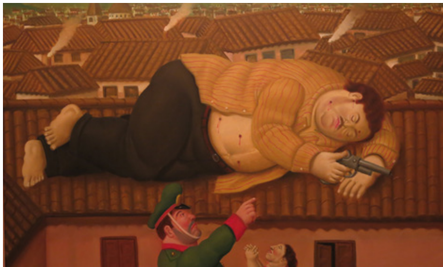
Knarkkungen Pablo Escobar målad av Botero.

träsk, tropisk regnskog och hav. En del av parken är stränder och även under vatten. Utría är en del av den biogeografiska regionen Chocó, ett område med hög global prioritet att bevaras på grund av dess biologiska mångfald, endemiska arter och är ett nationellt kulturarv.