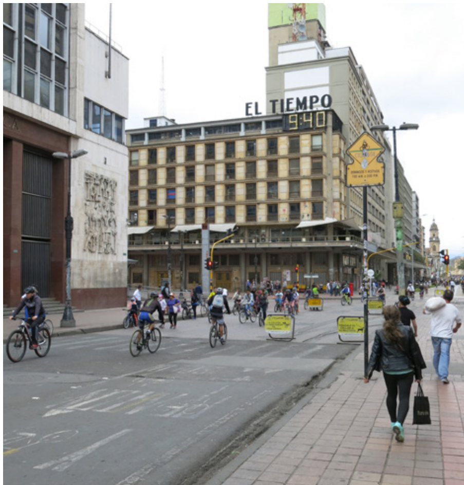
“Ciclovía”, söndag i Bogota.

råvaran och som samhällen och makt byggdes på. Guldet användes mer som en metall för att göra föremål för utsmyckning och ceremonier. Juicer, det finns om inte oräkneliga så i vart fall många olika. Vi började prova och försöka få fram vilken som smakar