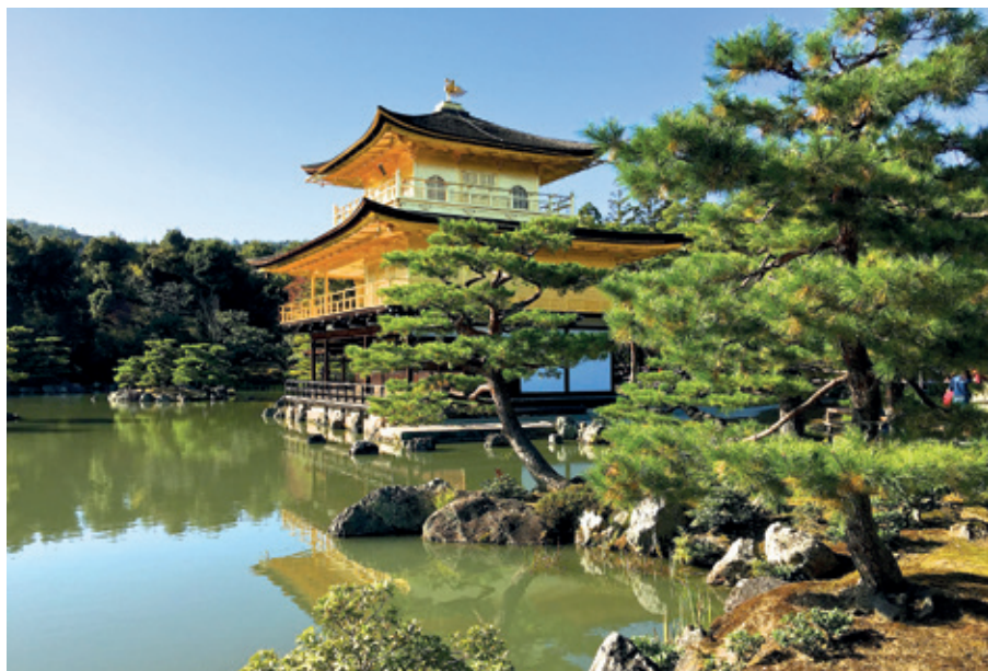
Guldpaviljongen i Kyoto.