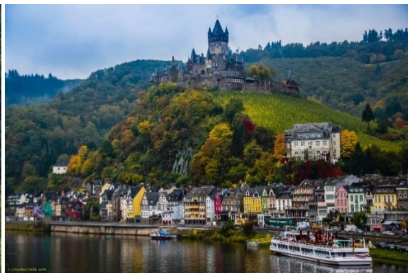
Slottet Burg Eltz som varit i samma familjs ägo sedan 1100-talet. Utsikt över Cochem från floden.