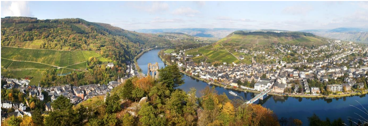
Floden Mosel slingrar sig fram genom Traben-Trarbach

Ikväll besöker vi en av byns vinkällare där vi får en visning, vinprovning och middag med traditionella, tyska rätter. Vår båt ligger bara 300 meter bort och det är lätt att själv återvända när man känner att man vill dra sig tillbaka.