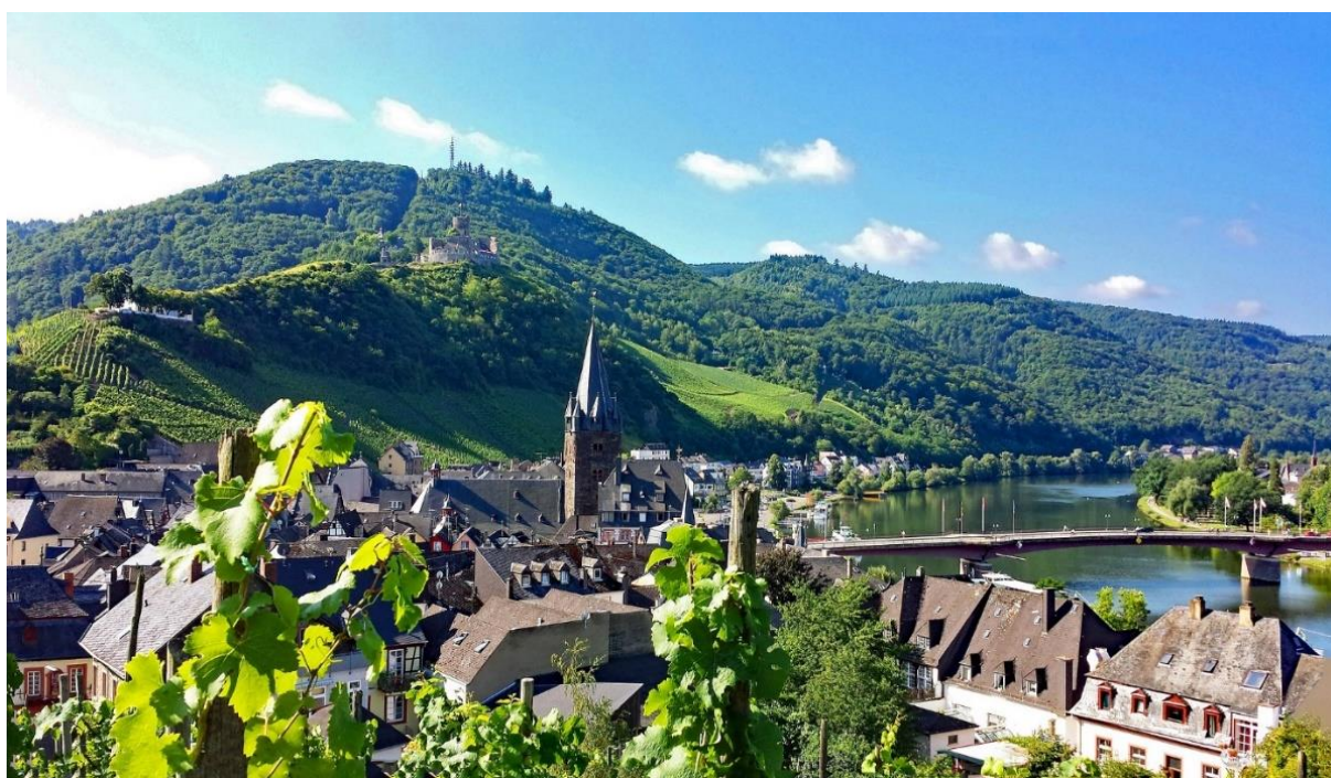
Vy över Bernkastel Kues

Klockan 06.00 lättar vi ankar och seglar nedför Mosel till byn Bernkastel Kues, även kallad centrum av mellersta Mosel, som är belägen på båda sidor om floden. Det har nu blivit en god vana att samlas klockan 10.00 i salongen och lyssna till Dick Harrison. Cirka 13.30 kommer vi fram till Bernkastel Kues och vi har hela eftermiddagen att njuta av denna pittoreska pärla. Ovanför staden tronar den imponerande ruinen av riddarborgen Landshut. I centrum finns unika kvarter av medeltida korsvirkeshus och det äldsta huset, "Spitzhäuschen" uppfördes 1416. En vacker stad att flanera i! Överallt längs Mosel odlas vindruvor för framställning av främst vita, fruktiga rieslingviner. Druvstockarna odlas på skifferjord som magasinerar solvärmens årets värme för att återge värmen åt stockarna under den korta tiden mellan blomning och skörd, vilket ger vinet dess karakteristiska friskhet med smak av citrus, aprikos och äpple. Idag kan du välja mellan en stadsrundtur till fots på cirka 1,5 timme eller att vandra med guide i vinbergen cirka 3 timmar.