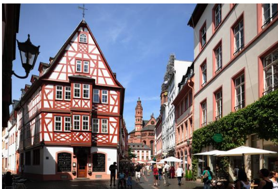
Vackra korsvirkeshus i den äldre delen av staden