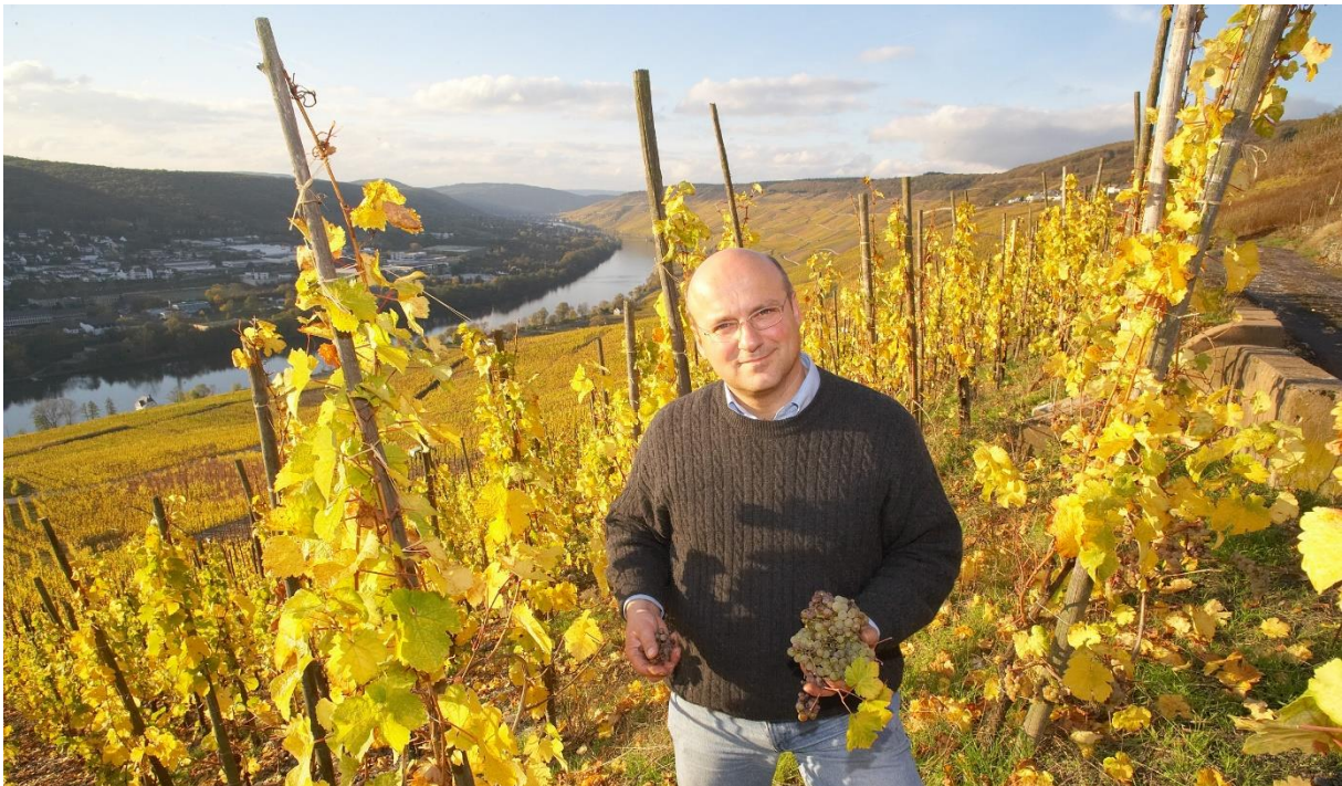
Både Rhen och Moseldalen är kända för sina goda viner