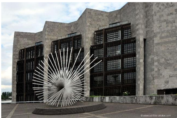
Rådhuset i Mainz

Det är vår sista kväll ombord och vi samlas i baren för att runda av vårt 30-årsfirande och tillika höstträff.