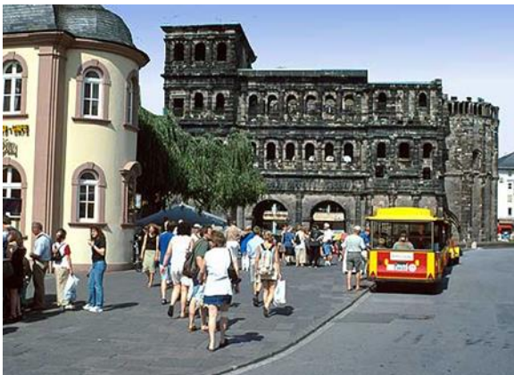
Stadsporten Porta Nigra i Trier

Efter lunch vid 2-tiden når vi staden Mehring. Här väntar bussar och kör oss cirka 30 minuter till den romerska staden Trier. Den grundades år 16 f. Kr. som Augusta Treverorum under den romerske kejsaren Augustus. Trier är inte bara känd som Tysklands äldsta, utan också som viktigt centrum för antika byggnader och konstskatter. Det visar sig redan vid första anblicken av Porta Nigra, den mest välbevarade stadsporten från den antika världen. Porten är än i dag landmärket för metropolen vid Mosel. Här finns en lång rad välbevarade historiska minnesmärken av världsklass och många av dem finns upptagna på UNESCO:s världsarvslista. Porta Nigra, amfiteatern, de berömda kejsartermerna där romarna badade och njöt, liksom den gamla bron Römerbrücke som fortfarande är en viktig trafikled, visar vilken betydelsefull stad Trier var under antiken. Konstantinbasilikan, Aula Constantina, är världens enda bevarade romerska kejsarhall. Idag är det en kyrka, men med samma utseende som när kejsare Konstantin tronade där på 300-talet. Även Triers medeltida byggnader gör ett djupt intryck som till exempel katedral S:t Peter, den äldsta i Tyskland, eller Liebfrauenkirche i tidig gotisk stil. Staden är Karl Marx födelsestad och huset där han föddes finns kvar. Vi delar upp oss i grupper och går en stadsrundtur med guide. Lagom till middagen återvänder vi med våra bussar till M/S Leonora.